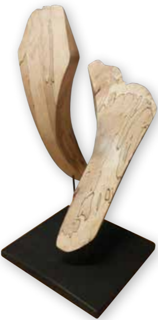
Tanz | Tanec. 2020. Holz | Drevo. H. 40 cm