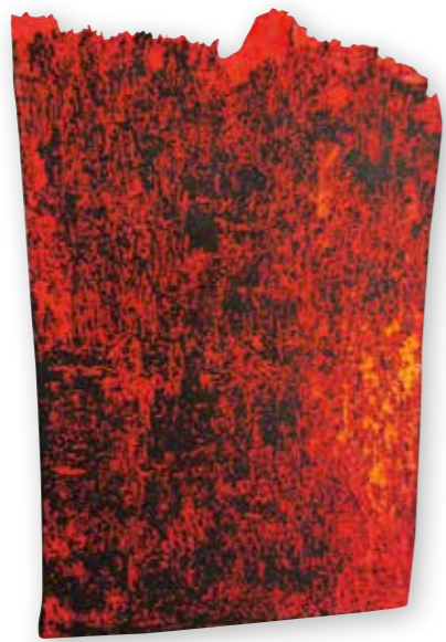
Lebenswege I | Cesty života I. 2023 Holz und Pigment | Drevo a pigment 60 x 40 x 8 cm