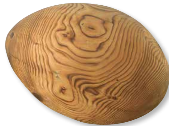
Ei | Vajce. 2013. Holz | Drevo. 60 x 80 x 60 cm