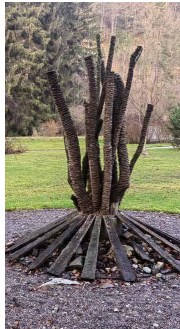
Keltisches Baumhoroskop | Keltský stromový horoskop. 2015 Holz, Beton | Drevo, betón. H. 300 cm