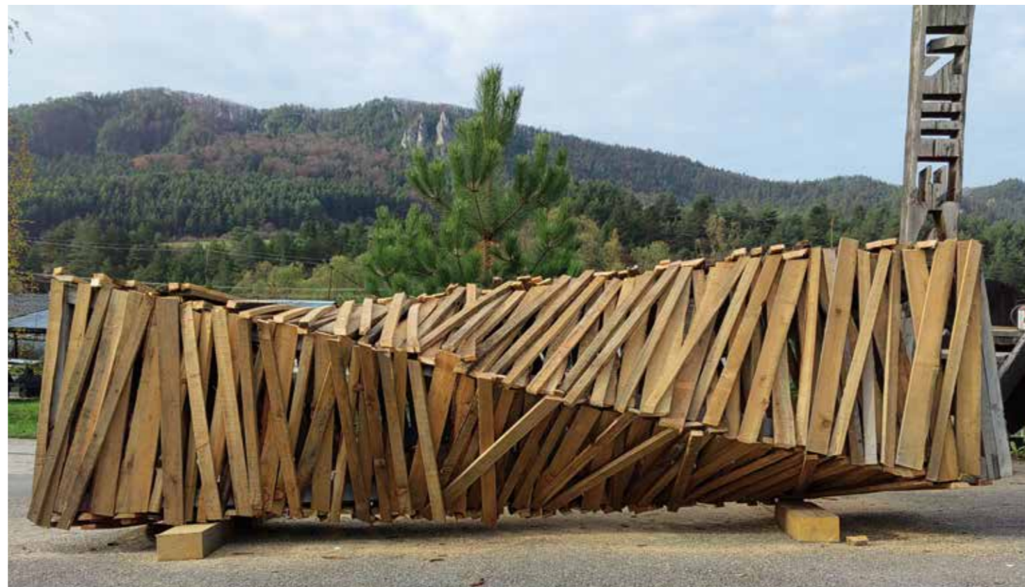
Spiral. 2023. Holz, Beton, Metall | Drevo, betón, kov H. 450 cm