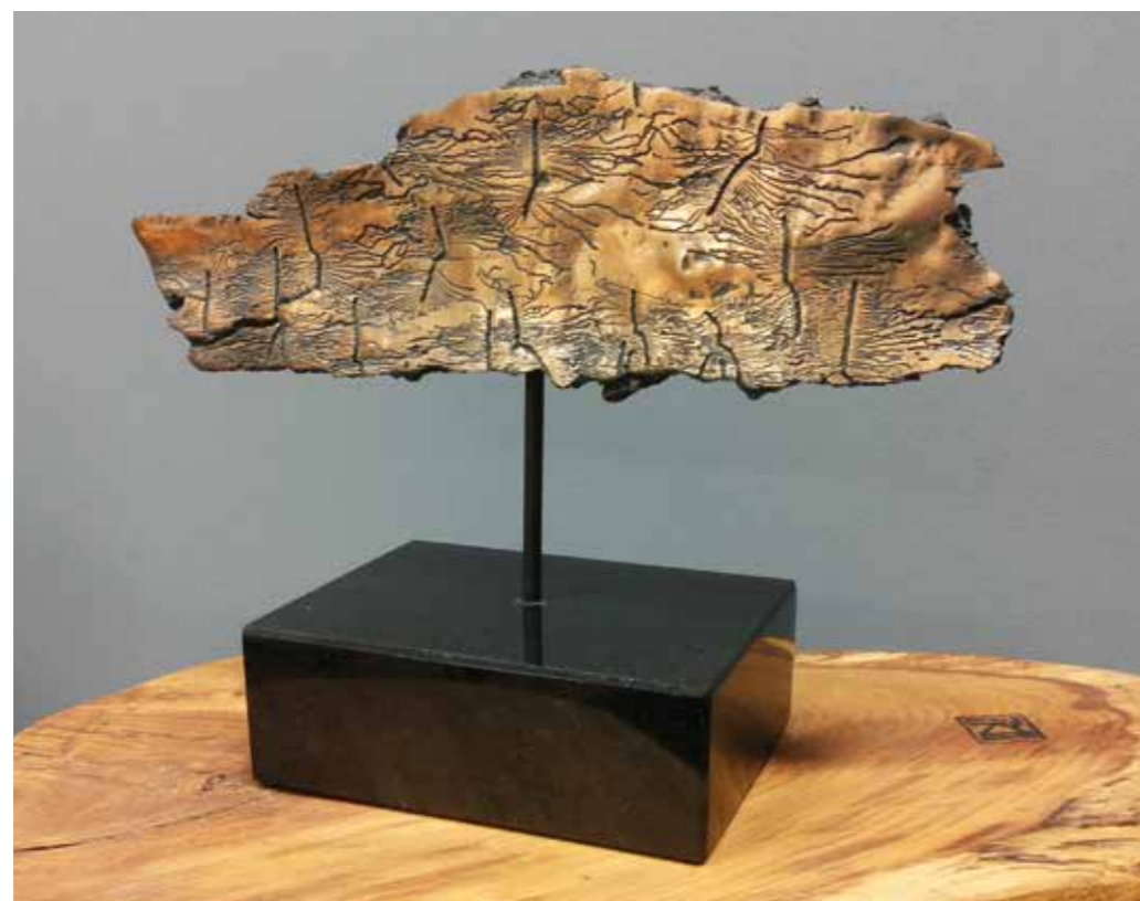
Spuren I | Stopy I. 2013. Bronze | Bronz. H. 30 cm