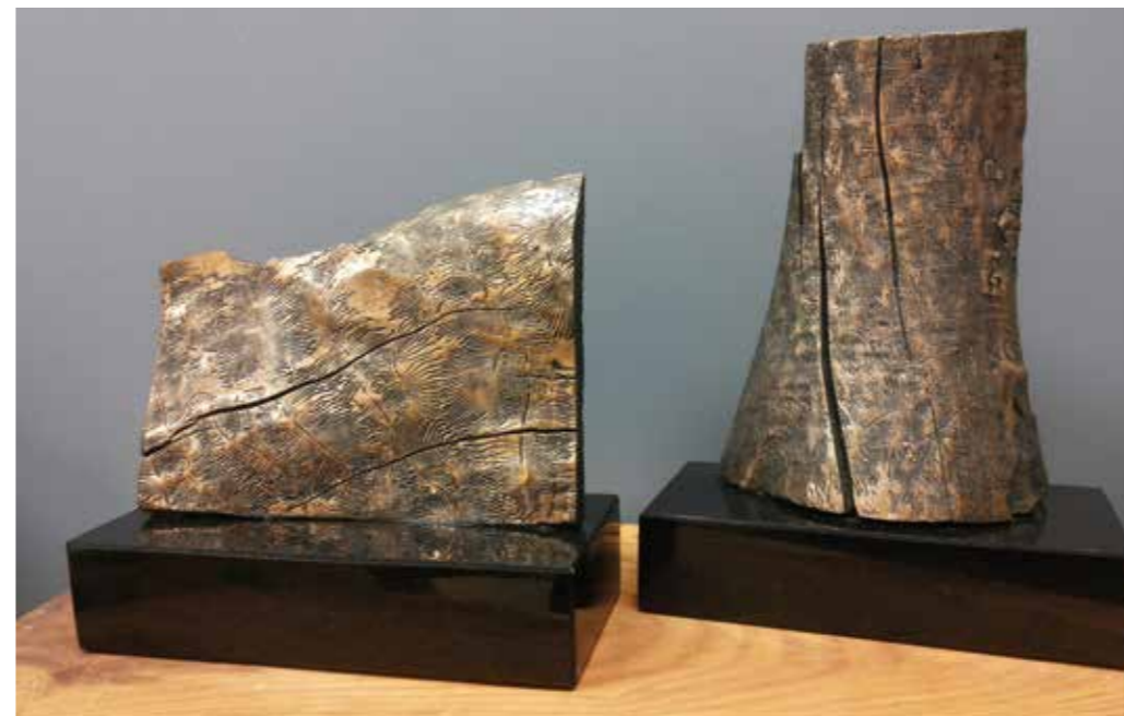
Spuren II | Stopy II. 2013. Bronze | Bronz. H. 30 cm Spuren III | Stopy III. 2013. Bronze | Bronz. H. 40 cm