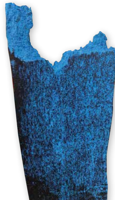
Lebenswege III. | Cesty života III. 2023 Holz und Pigment | Drevo a pigment. 70 x 40 x 8 cm