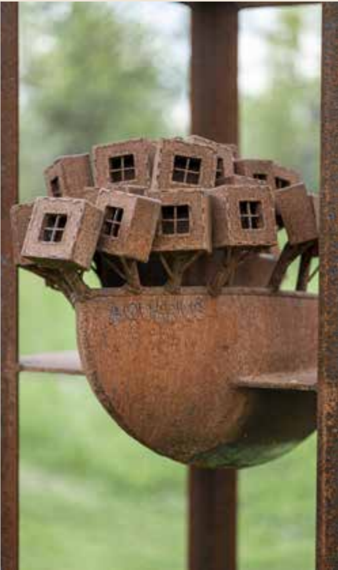
Ondrej 4.: Aquarius. Detail I Détail. 2022 Zváraná oceľ | Acier soudé. 250 cm