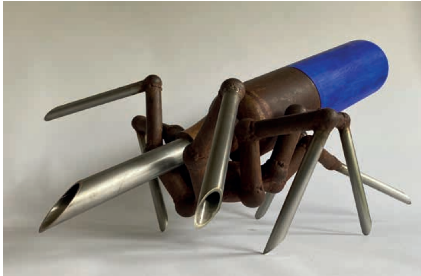
Ondrej 4.: Čierna vdova | La veuve noire. 2023 Oceľ, antikor, akryl | Acier, inox, acrylique. 42 x 76 x 53 cm

Il vit aujourd'hui à Turzovka et se consacre à la sculpture et à la peinture de chambre et monumentale. Il a participé à des dizaines d'expositions individuelles et collectives dans son pays et à l'étranger, et ses œuvres font partie de nombreuses collections publiques et privées.