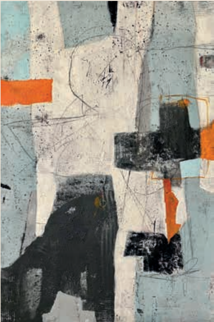
Zuzana Schmidt: Volný pád I La chute libre. 2023 Kombinovaná technika | Technique combinée. 150 x 100 cm