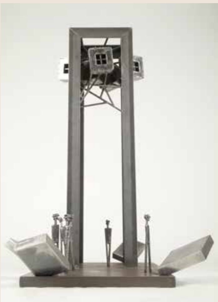
Ondrej 4.: Bydlo Boha bleskov I La demeure du dieu de l'éclair. 2014 Zváraná oceľ | Acier soudé. 103 x 46 x 70 cm