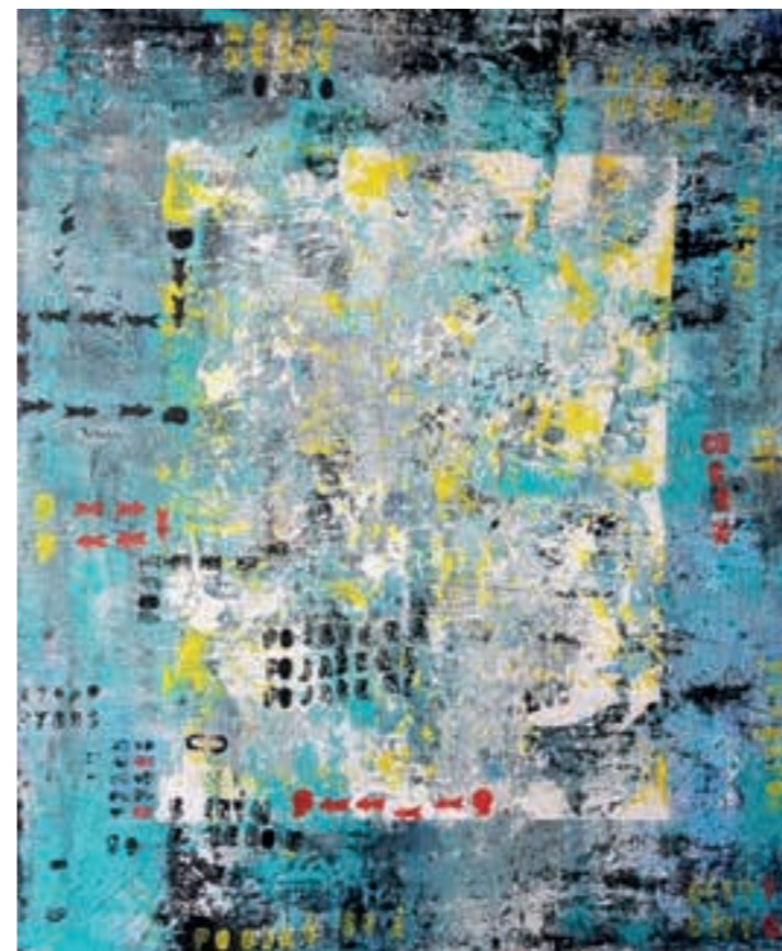
Zuzana Schmidt: Pojašená | La folle. 2021 Kombinovaná technika | Technique combinée. 120 x 100 cm