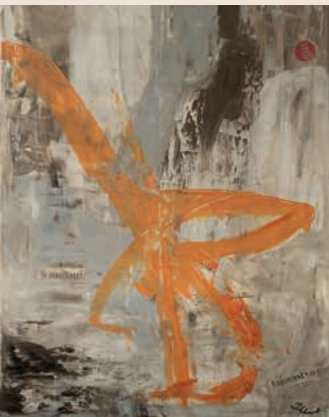
Zuzana Schmidt: O mužoch I Sur les hommes. 2019 Kombinovaná technika | Technique combinée. 100 x 70 cm